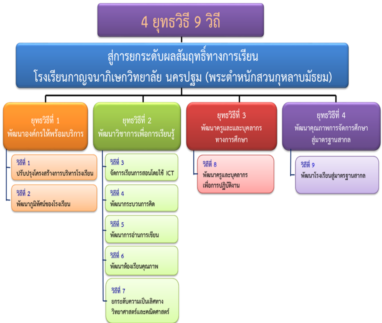
แผนภูมิที่ 1 แสดงกลยุทธ์การบริหารโรงเรียนกาญจนาภิเษกวิทยาลัย นครปฐม (พระตำหนักสวนกุหลาบมัธยม)